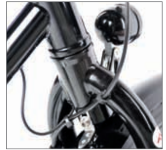
Schlicht, schön, stark: der Übergang Steuerrohr und Gabelkrone.