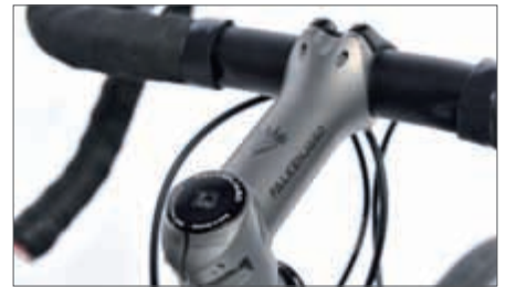
Links: Scheibenbremsaufnahme aus Titan und Steckachsen. Mitte: Die neuen leichten Disc Laufräder kommen von Tune hat. Rechts: Der Vorbau kommt ebenfalls zum Falkenjagd.