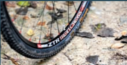
Leicht und schnell sind die Laufräder von Tune. Sie sind sogar die leichtesten im Test.