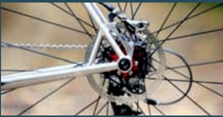
So schön kann Stahl sein. Der Hinterbau ist technisch und optisch top.